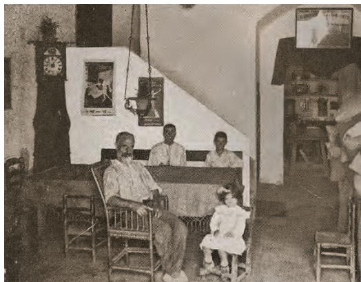
FIGURA 7. Menjador del Mas Germinal amb els fills i un treballador. Any 1909