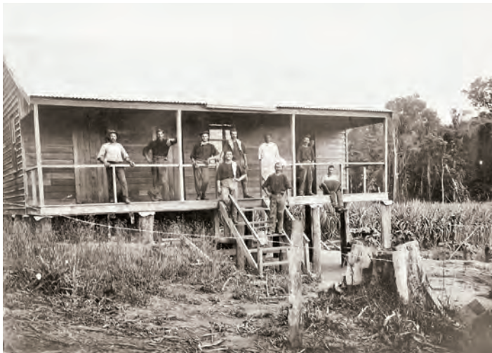
FIGURA 4. La casa a la finca agrícola de Bendigo amb treballadors