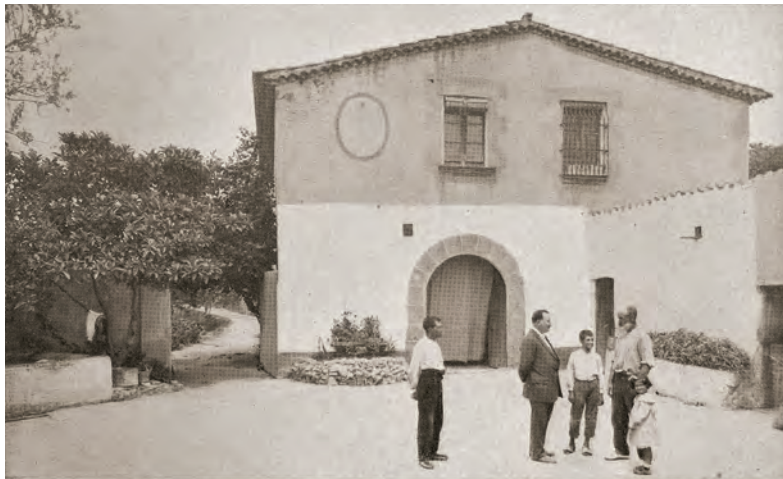
FIGURA 5. Mas Germinal, a Montgat