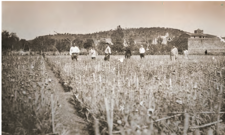
FIGURA 9. Extens camp de clavells de la família Ferrer a Llançà. Anys vint