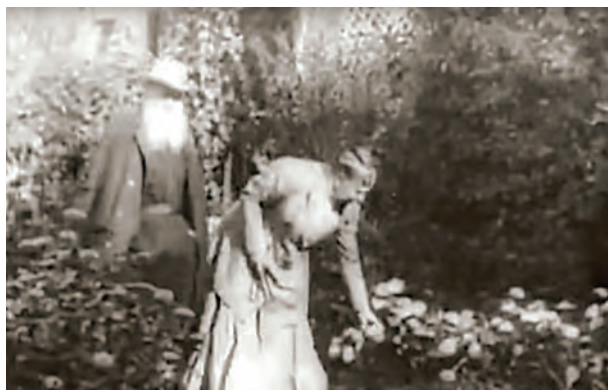
FIGURA 11. Lleó Tolstoi i la seva esposa Sofia al jardí que cultivaven de Yásnaia Poliana (Rússia). Anys 1900